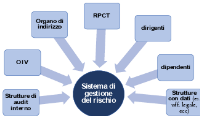
Figura 2 - Gli attori coinvolti nel sistema di gestione del rischio

Preme a questo punto sottolineare che il Comune di Rifreddo è un Ente con meno di 50 dipendenti e pertanto applica il punto 10 del PNA 2022 recante “ semplificazione per le amministrazioni ed enti con meno di 50 dipendenti ” per quel che riguarda il processo di gestione del rischio.